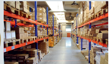
Lager und Logistik